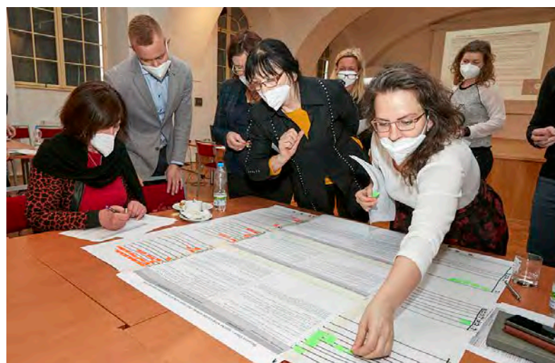
Poslední workshop pro veřejnost se bude konat 7. dubna v budově Krajského úřadu a budou se na něm probírat aktivity, které povedou k naplnění vizi a cílů strategie.

Olomoucký kraj připravuje novou koncepci rozvoje kultury. Do její přípravy zapojil také města, obce a lidi, kteří v oblasti kultury pracují. Zatím poslední dva workshopy proběhly v polovině února ve Vlastivědném muzeu v Olomouci a zúčastnilo se jich téměř osmdesát zájemců. Účastníci nejprve vybrali problémy, které vnímají jako zásadní v oblasti kultury a kulturního dědictví, a poté v menších skupinách rozebrali příčiny těchto potíží a jejich dopady. V závěru každého bloku pak vymysleli náměty pro vizi budoucí strategie. „Těší nás zájem kulturní veřejnosti o zapojení se do tvůrčího procesu. S vysokou účastí jsme se setkávali už na podzim při realizaci workshopů ve vybraných obcích s rozšířenou působností a potvrzuje se i nyní,“ uvedl Jan Žůrek, radní pro kulturu a památkovou péči Olomouckého kraje.