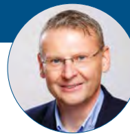
Petr Měřínský primátor města Přerova

Do této chvíle se ruská agrese na Ukrajinu do chodu města příliš nepomítla. Ukrajinské rodiny, jež k nám zatím přišly, zde většinou mají vlastní zázemí. S našimi partnery nabízejícími ubytování se ale připravuje na příchod lidí, kteří budou potřebovat větší pomoc. Už dopředu se snažíme nastavit nějaké procesy, abychom mohli pomáhat rychle a efektivně. Také se na nás obrátilo naše ukrajinské partnerské město Dubno s prosbou o konkrétní materiální pomoc. Vyhlásili jsme proto sbírku zdravotnického materiálu a dalších potřeb, k tomuto účelu jsme také zřídili transparentní účet.