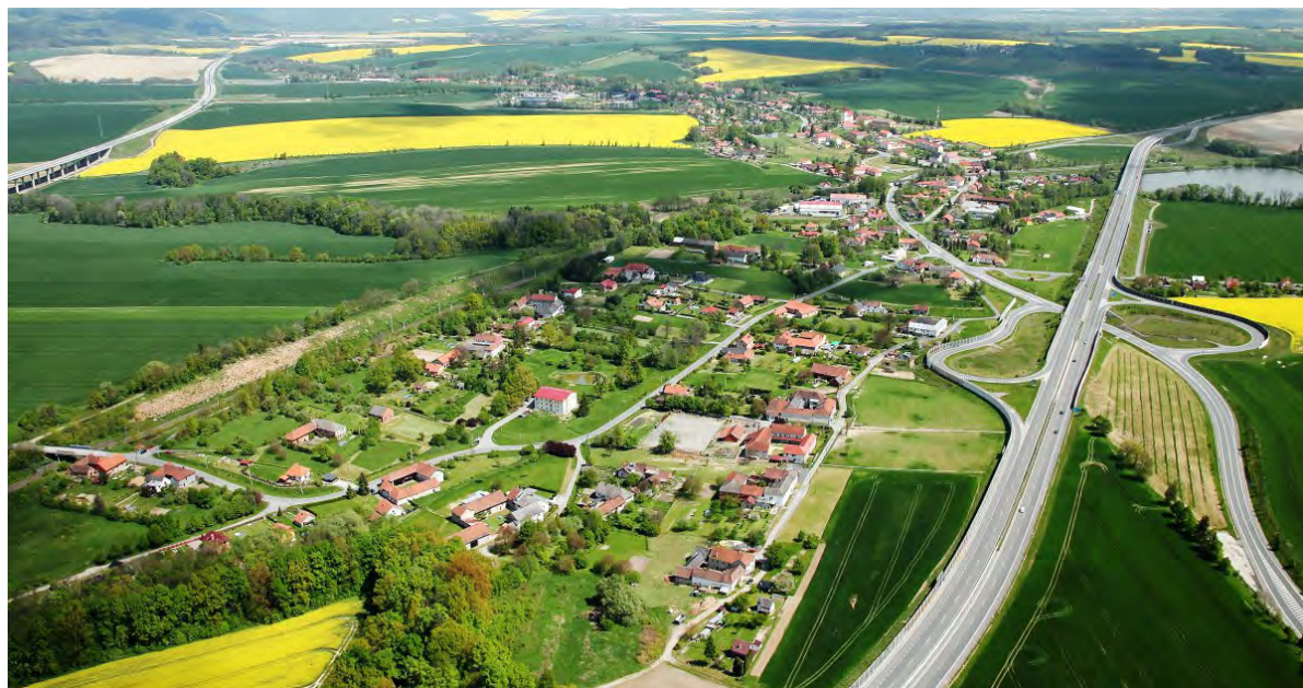
Zatím posledním vítězem krajského kola soutěže se v roce 2019 stala obec Běloutín.