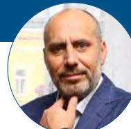
František Jura primátor statutárního města Prostějova

Už v době, kdy situace eskalovala v diplomatické rovině, jsme jako město vyjádřili Ukrajině podporu. Po vypuknutí války jsme navázali kontakt s městem Černivci na jihozápadě Ukrajiny a zorganizovali jsme sbírku materiálu podle jejich požadavků. Ke sbírce jsme přidali další potřebné věci, jako zdravotnický materiál, dalekohledy či termovize, a na ně jsme uvolnili z rozpočtu města 1,5 milionu korun. Chystáme další sbírku různých zařízení pro civilní ochranu města Černivci. V evakuačním centru na Tererově náměstí jsme připravili zázemí pro přechodné ubytování stovky lidí a další asi tři desítky míst jsme vytvořili v azylovém domě pro ženy a matky s dětmi. Oběma těmito zařízeními už prošly desítky žen s dětmi. Jsme připraveni pomáhat dál, události nasvědčují tomu, že ta hrozná situace hned tak neskončí.