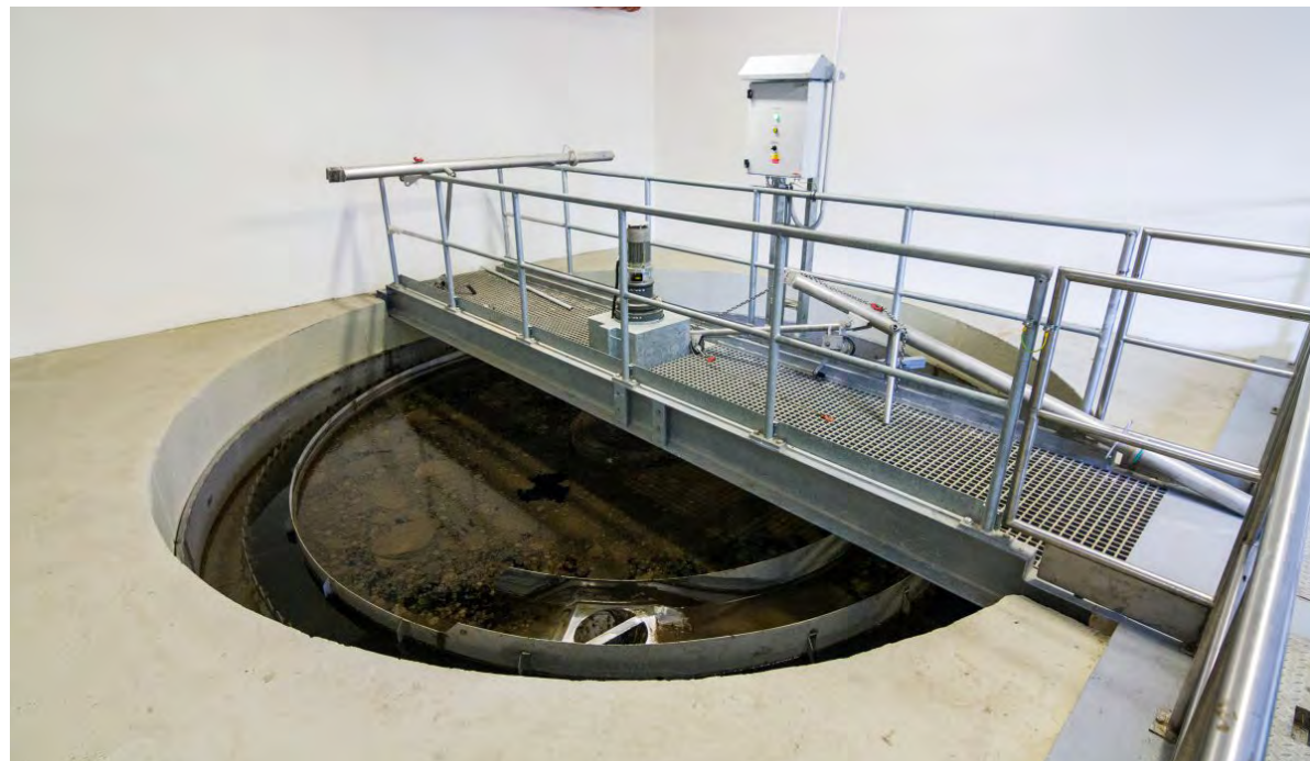
Hejtmanství uvolní peníze na podporu výstavby čistíren odpadních vod, vodovodů a kanalizací, ale i na stavby poldrů či založení studánek.

padních vod nebo na obnovu environmentálních funkcí krajiny, tedy především na obnovu