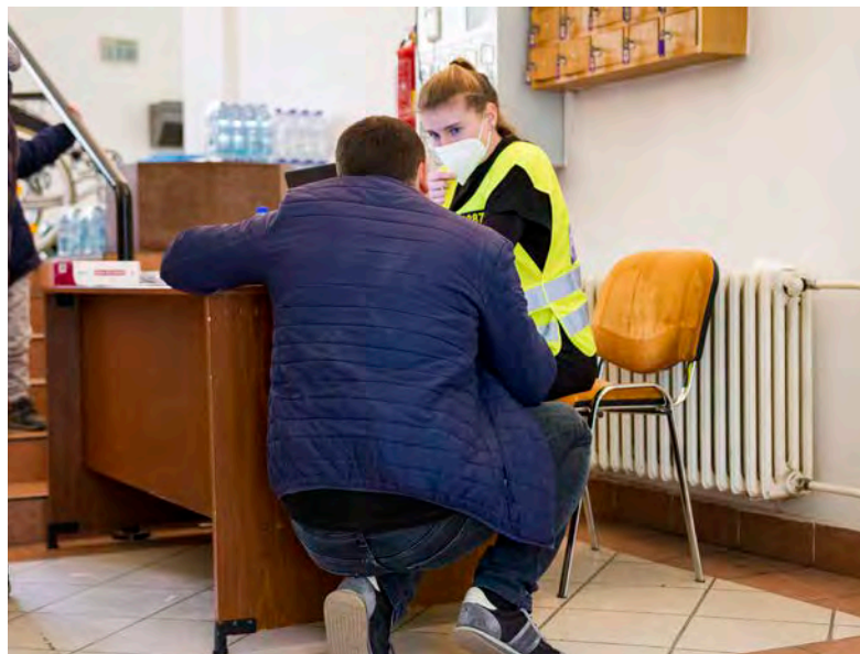
S komunikací s Ukrajinci pomáhají třeba studenti Univerzity Palackého a další dobrovolníci

Aktuální je pomoc válečným uprchlíkům, pro které vzniklo velmi rychle