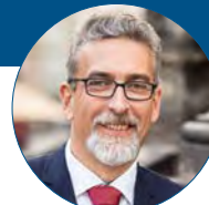
Miroslav Žbánek primátor města Olomouc

Ve Šternberku koordinujeme pomoc lidem z Ukrajiny po dohodě s krizovým štábem Olomouckého kraje. Veškeré nabídky ubytování, hmotné pomoci směřujeme do centrální evidence na krizový štáb. Město připravilo a s pomocí darů spoluobčanů, Charity apod. vybavilo zatím 4 byty pro uprchlíky z Ukrajiny. Byty obsazujeme po dohodě s krizovým štábem. Od úterka 8. března jsou již 2 byty obsazeny a nyní očekáváme další ukrajinské rodiny. Jde o rodiny, které měly cíleně zájem o pobyt ve Šternberku. Ve městě působí také další organizace např. Charita, která organizuje materiální pomoc, Dětský klub Eccáček, z.s., nabízí prostory své herny pro využití maminek s dětmi. Pomoc organizují také občané města, ať již poskytnutím ubytování, nebo finanční či materiální podporou. Děti, které přišly do Šternberka společně s maminkami, se budou postupně začleňovat v našich mateřských a základních školách a volnočasových zařízeních.