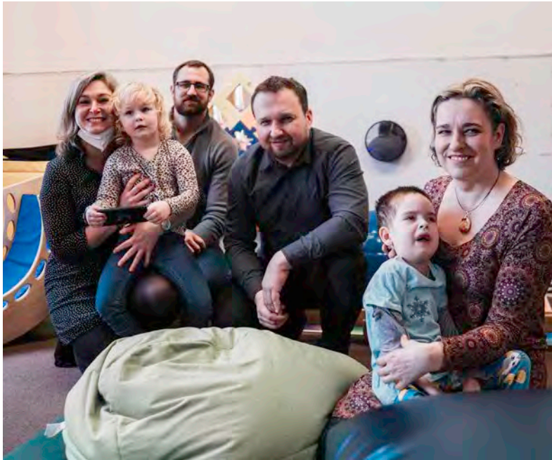
Ministr práce a sociálních věcí na setkání s rodiči hendikepovaných dětí.