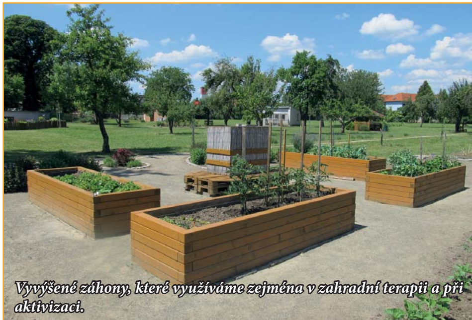
Vyvýšené záhony, které využíváme zejména v zahradní terapii a při aktivizaci.