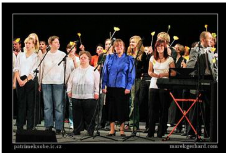
Závěrečnou píseň si společně zazpívali všichni účastníci koncertu.